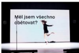
DVACETjedna Spitfire Company