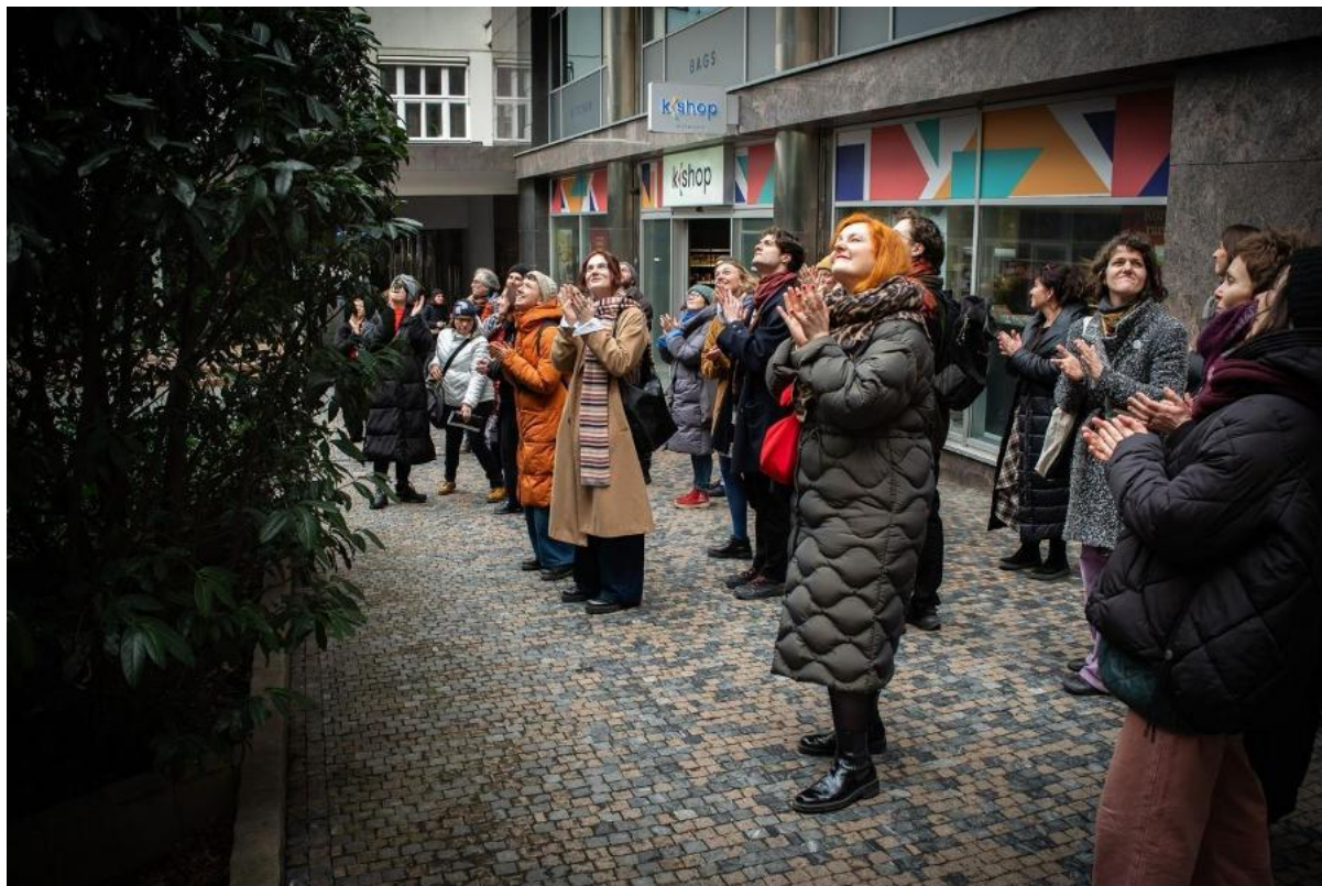
Aplaus přiliv, pasáž Paláce Archa, Praha

Specifickou dramaturgickou kategorií tvořily komponované programy , jako byly performativní procházky Applaus přiliv a odliv nebo tematické odpoledne v kulturní stanici Galaxie . Tyto bloky nabízely divákům možnost setrvat v jednom prostředí delší čas a sledovat různé formy práce v širších souvislostech. Celý festivalový ekosystém pak organicky doplňovaly neformální situace , včetně závěrečného večírku, který sloužil jako přirozené místo pro bezprostřední setkání umělecké obce s publikem.