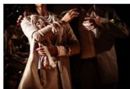
Proč je taková? RUN OPERUN