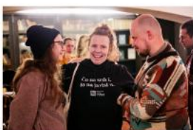
Dramaturgická inventura II