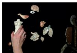
Blackout A.J. Nosorožec