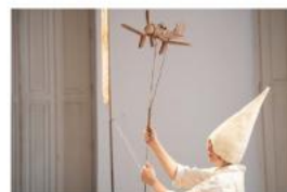
V záři blesku Terén