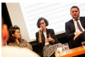
Symposium ART-IN-RES, Kick-off meeting evropského projektu Bridging the AIR (BtAIR)