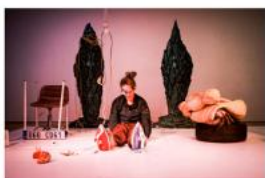
Jsme, Chobotnice Ghost Compost