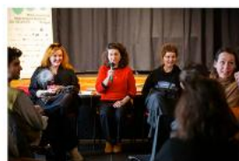
Kulatý stůl o udržitelném financování nezávislé scény