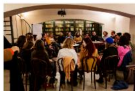
Dramaturgická inventura I