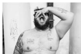
LEMONADE (No Other Troy) PINKBUS Platform