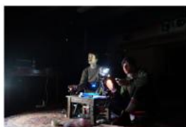
Kawloon: Největší dům na světě FRAS