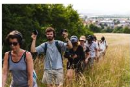
Lovci mají oči pre plač Divadlo Setkáni