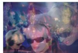
I keep looping