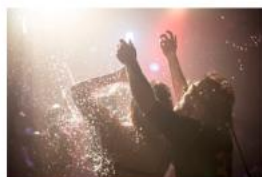
SYNESTHETIC FLESH Simulakrum