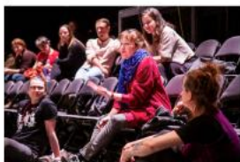
Diskuze Malé inventory 2026