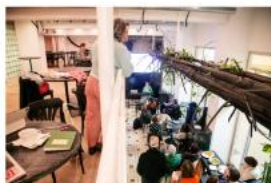
Meet the Guests I