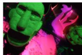
Brrr & Skrrr KHWOSHCH