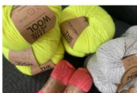
Očko za očkem