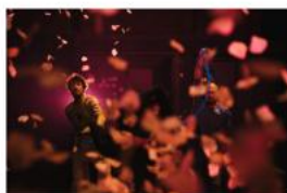
Vrčení – theatrum suis generis Wariot Ideal