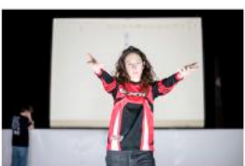
One Gesture (premiéra)