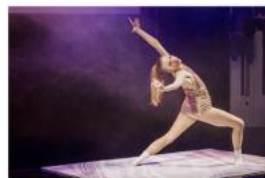
Iconic Program Beautiful Confusion