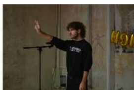
Nenásilná těla (work-in-progress)