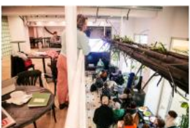
Meet the Guests II