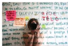
Všem matkám i ne-matkám