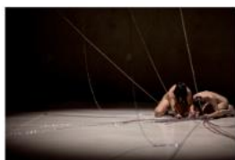
LUSH BLAST: Tasting the Untamed Alica Mínar & col., Dorota