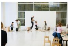
Herna pro děti 1,5–5 let s dospělými: přemýšlet jako chobotnice