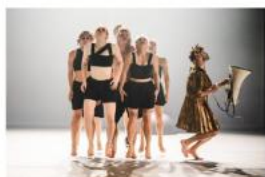
St.art Cirk La Putyka