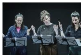
Matko Boží, vyžeň Putina Boca Loca Lab