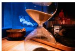
8 miliard lidí hoří Blidi