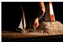
Plechovka, maják a ryba R405