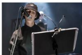
Your Silence Will Not Protect You Masakr Elsinor